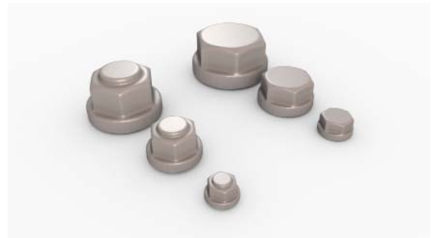
Schraubenmuttern / Schraubköpfe